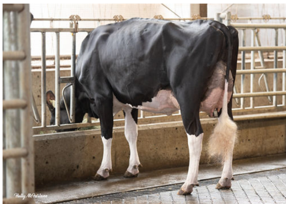
PROGENESIS CHAMPION PALAZZO DAM